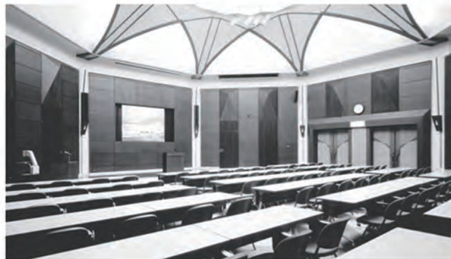
開講式・オリエンテーション・共通教科I(合宿研修) 研修室