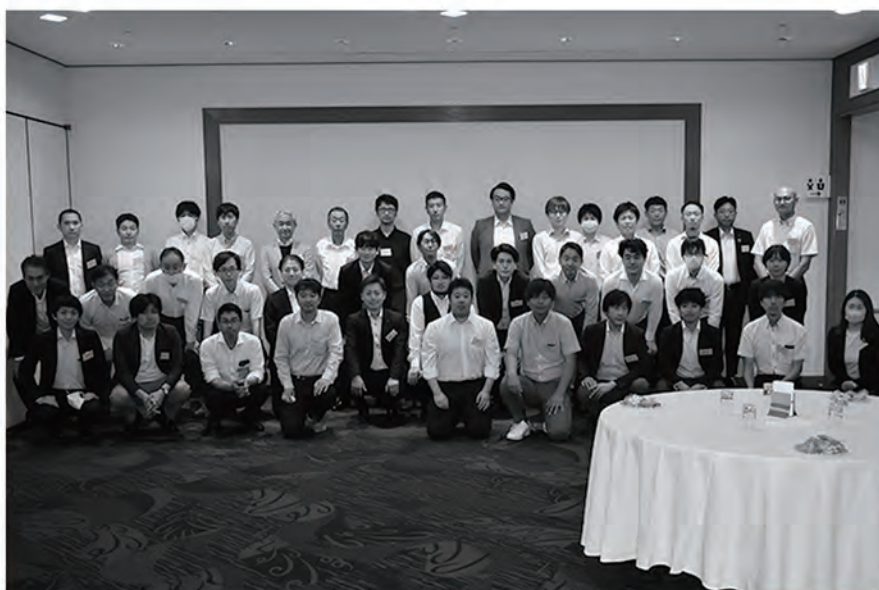
2023年度 包装専士講座受講生