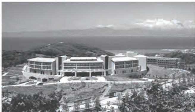
開講式・オリエンテーション・共通教科I(合宿研修) 会場